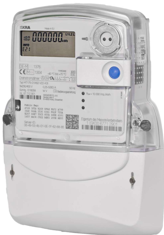
Abb. 1 (moderne Messeinrichtung)

Die Stadtwerke Geesthacht GmbH gewähren den Bezug des Sonderstromproduktes Strom E-Mobilität unter der Voraussetzung, dass eine zusätzliche Zählerinrichtung (siehe Abb 1.) zur Messung und Abrechnung des anfallenden Ladestroms kundenseitig über einen Elektrofachbetrieb zur Verfügung gestellt wird und ordnungsgemäß im Abrechnungssystem der Stadtwerke Geesthacht erfasst ist. Zudem muss ein Steckplatz für den möglichen Einbau einer steuerbaren Einrichtung (gem. § 14 a EnWG, Niederspannung) vorgehalten werden. Der Kunde informiert sich vor Abschluss des Auftrags zum Sonderstromprodukt über anfallende Kosten des Einbaus/ Umrüstung der Kundenanlage über einen entsprechenden Elektrofachbetrieb.