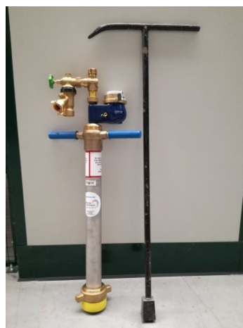
Bauwasseranschlüsse der Stadtwerke Geesthacht